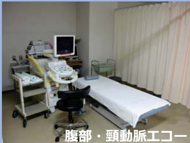
腹部・頸動脈エコー